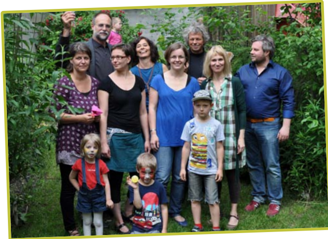
Team 1983 und Vorstand 2013