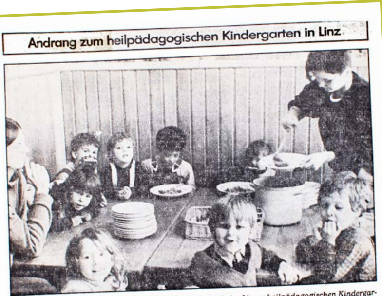
Ändrang zum heilpädagogischen Kindergarten in Linz