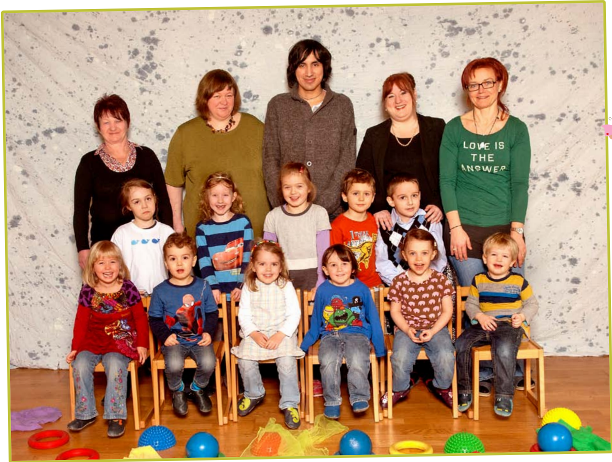
KINDER UND TEAM DER SONNENSTRAHLENGRUPPE 2012 / 2013