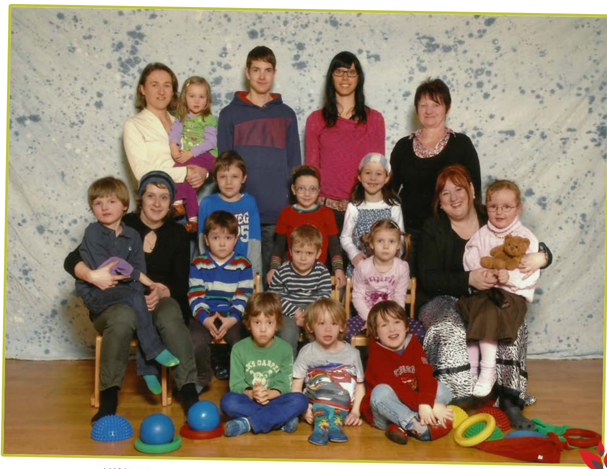
KINDER UND TEAM DER ELEFANTENGRUPPE 2012 / 2013

Dieses Jahr erschien uns das Jahresthema unerschöpflicher denn je. Somit werden wir mit einem Rucksack an weiterführenden Ideen das Kindergartenjahr beenden. Da die Wahrnehmung des eigenen Körpers und dessen Förderung einen zentralen Bildungsauftrag darstellt, werden wir diesen Rucksack mittragen und hoffentlich bald das eine oder andere auspacken.